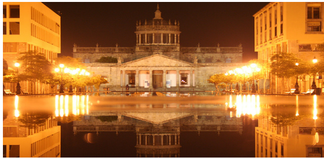
Hospicio Cabañas, Guadalajara, Mexico