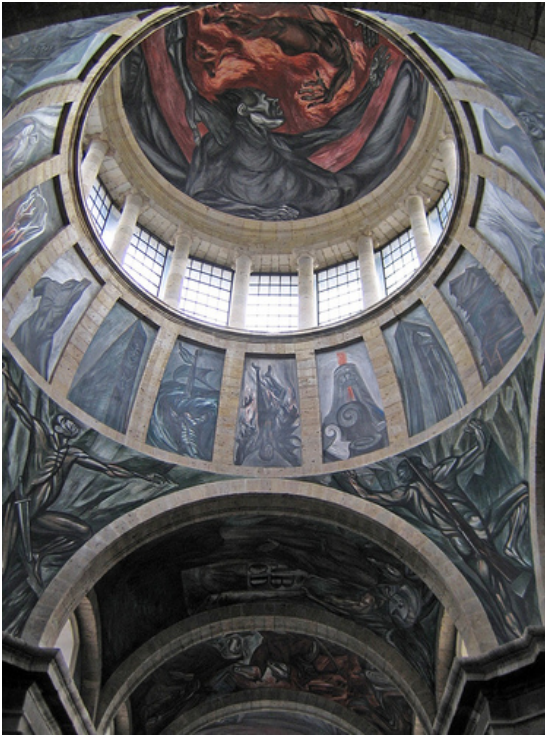
2008 IOHA International Conference Hospicio Cabañas, Guadalajara, México

http://www.oah.org/meetings/2009/call.html